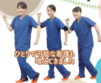
ひとりで可能な看護も 増えてきました