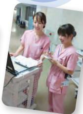
毎月フォローアップ 研修を開催