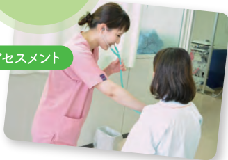
フィジカルアセスメント