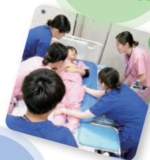
基礎看護技術研修