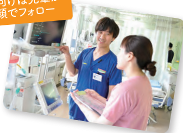
振り向けば先輩が 笑顔でフォロー