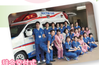
辞令交付式 新規採用者オリエンテーション