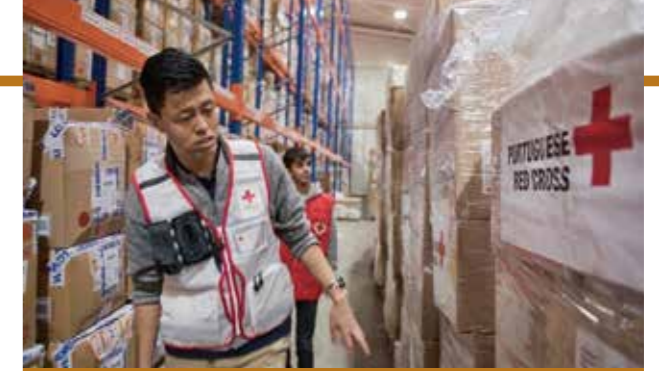
モルドバで倉庫管理をする事務管理要員

当院にも4名の国際救援要員がおり、国際活動派遣の機会に備えて日々研鑽しております。