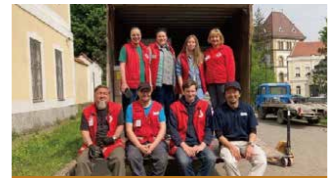
ウクライナの仮設診療所で活動する薬剤師(上)と診療放射線技師(下)